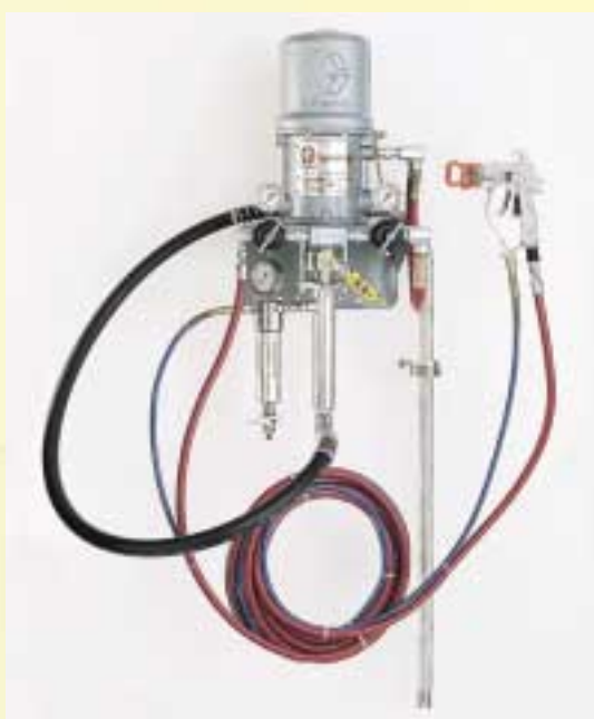
Kompaktní zařízení GRACO PRESIDENT pro nástřiky technikou airless s podporou vzduchu umožňující snižování obsahu a emisí rozpouštědel při stříkání.

Jako zástupce americké firmy GRACO pro Českou republiku disponuje MEDIA výrobkovou základnou pneumatických, hydraulických a elektrických čerpadel, míchadel, regulačních a dávkovacích prvků a aplikačních pistolí, celosvětově oceňovanou pro svoji spolehlivost, kvalitu a široký výběr. V roce 1999 firma GRACO navíc koupila firmu BÖLLHOFF VERFAHRENS-TECHNIK, s níž dříve společnost Galatek spolupracovala v oblasti aplikační techniky, a MEDIA po vzájemné dohodě převzala i péči o zákazníky s jejich výrobky.