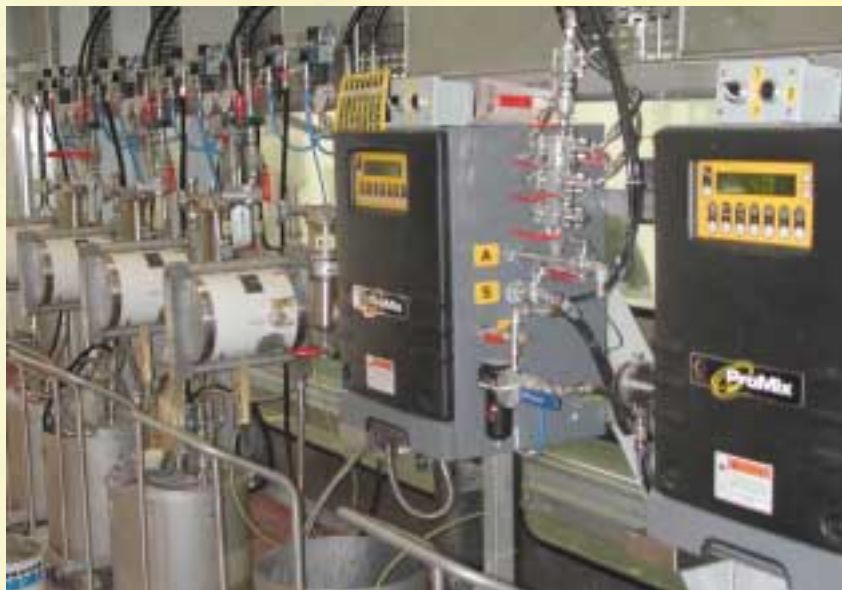
Dvoukomponentní, elektronicky řízené zařízení GRACO PROMIX s centrálním zásobováním barvou s možností sledování statistiky přesnosti míchání a spotřeb pro účely systému řízení jakosti a kalkulace nákladů.

v Mladé Boleslavi (2000) a v Kvasinách (2001) a vybavení lakovny zákaznických oprav v KAROSA a.s. aplikační technikou (2001).